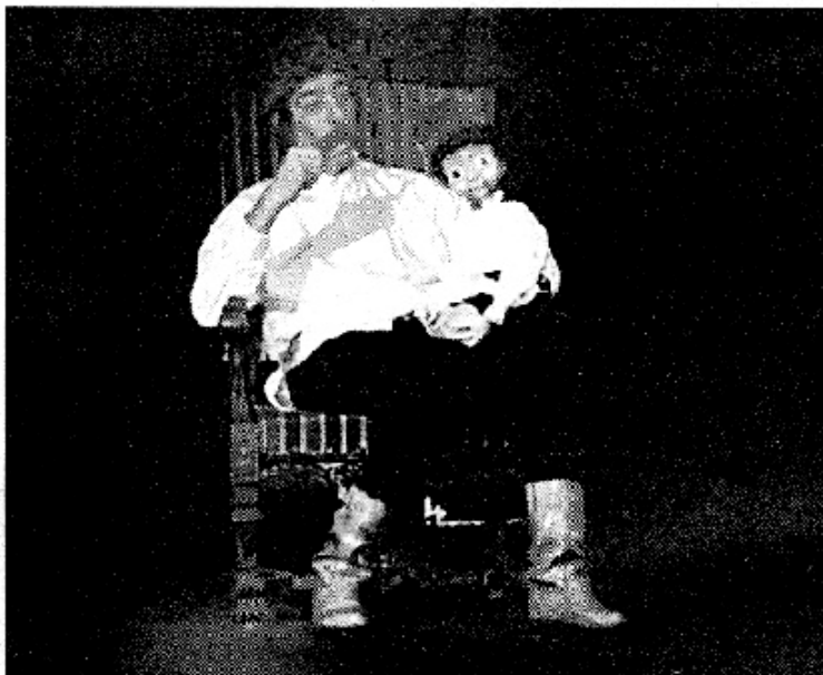
Le grand-père (en chair et en os au début du spectacle), présentant les instruments de musique à son petit-fils