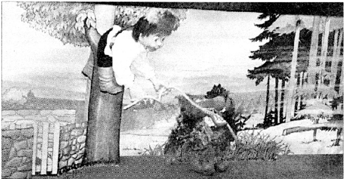
Pierre, en train de terrasser le loup

Ainsi commence ce spectacle de marionnettes à fils et comédiens, bâti autour de la musique de Prokofiev en version intégrale. A chaque personnage sa ritournelle, Pierre, l'Oiseau, le Canard, le Chat, le Grand-père, les trois chasseurs, et, bien sûr, le Loup, autant de protagonistes aisément identifiables à l'écoute. Dans un décor conçu et réalisé par Gux, ces personnages évoluent au rythme de la musique, et plongent le spectateur dans un univers empreint de poésie.