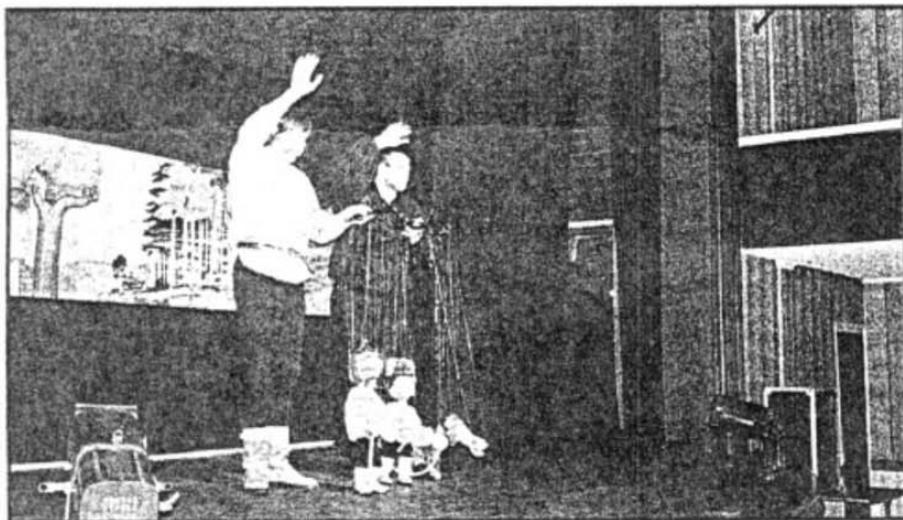
Le jeu des comédiens-marionnettes de la Compagnie Histrion est excellent.

Cette version de “Pierre et le loup” est basée sur la musicale de Sergèï Prokofiev, en version intégrale. Il en résulte que les enfants sont ainsi introduits à la musique classique. Et ce dans une atmosphère agréable et amicale. Tout simplement bravo!