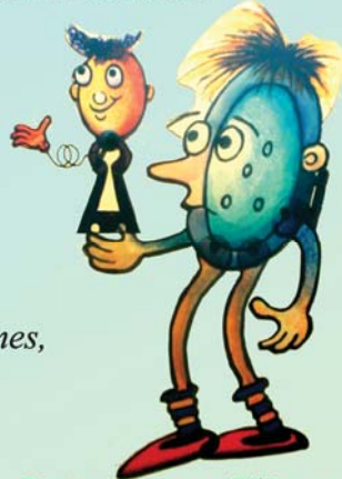
Bouton de porte et Ti'Bouton

Un spectacle tout en couleurs, en rimes, et en chansons !